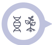
Veredelaar/ Young Plants

Door klimaatverandering is er sprake van toenemende vraag naar gewassen die bestand zijn tegen extremere weersomstandigheden.