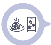
E-tail, retail en foodservice

Door middel van online initiatieven wordt er direct(er) aan de consument geleverd.