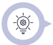
Kennis & kunde

Samenwerkingen vanuit de gehele keten en met universiteiten om kennis lokaal en internationaal toe te passen.